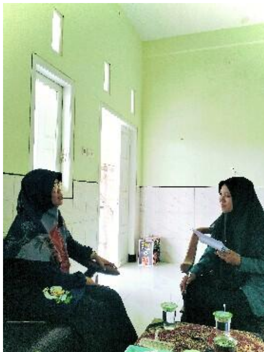
Wawancara dengan Waka Kurikulum