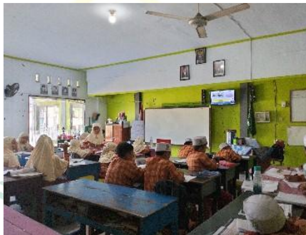
Dokumentasi Pelaksanaan kegiatan Pembelajaran

Dari hasil wawancara tersebut dapat disimpulkan pada kegiatan penutup disini, yaitu evaluasi pemahaman peserta didik terhadap materi pembelajaran, sehingga dapat dipastikan bahwa pembelajaran berhasil mencapai tujuan.