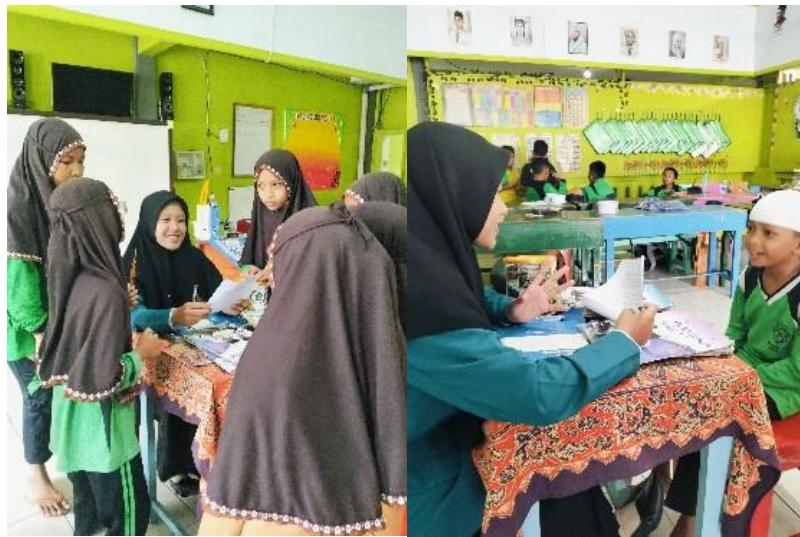
Wawancara dengan siswa kelas IV