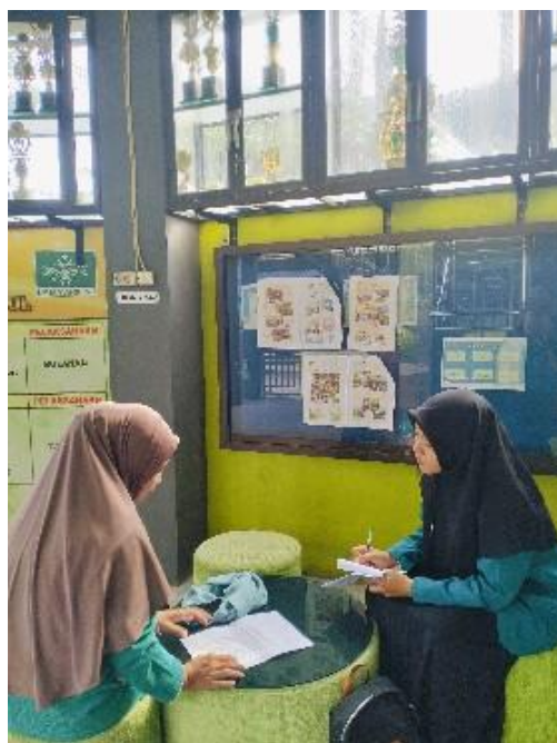
Wawancara dengan Guru Kelas IV A