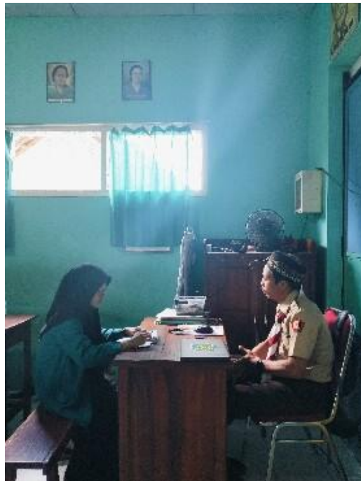
Wawancara dengan Guru Kelas IV B