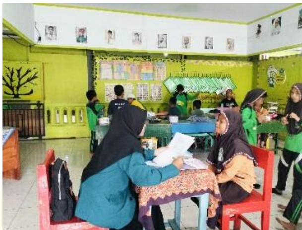
Wawancara dengan salah satu siswa kelas IV

pelajaran. Penggunaan media audio visual juga dapat meningkatkan motivasi belajar siswa, menarik perhatian, dan mempermudah pemahaman materi yang abstrak.