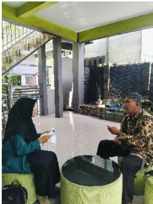
Wawancara dengan Guru kelas IV C