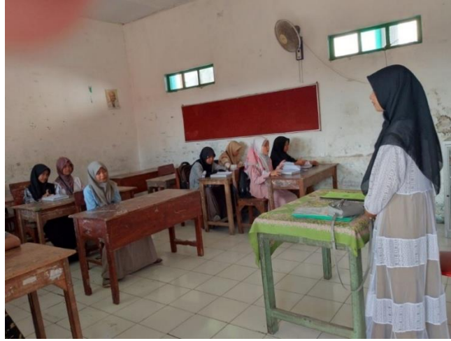
Kegiatan muroja'ah di kelas bersama ustadzah